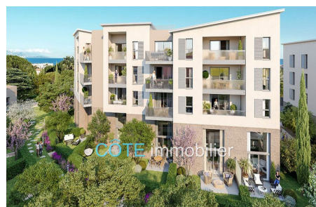
Programme neuf - Convention milancip - MLS Côte d'Azur